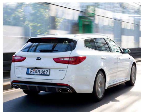
Ülal. Optima hinnad algavad 24 290 eurost, GT-mudel maksab umbes 37 000 eurot.

Paremal. Soliidne sisekujustus on Kia plusse, nagu ka rikkalikud varustusvõimalused.