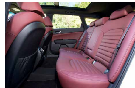
Tagaistmel on ruumi lahedalt. Pakiruumi suurendamiseks saab istmed alla klappida.