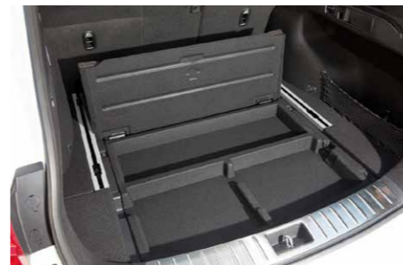
Pakiruumi põhja all leidub hulk panipaiku. Pakiruum mahutab üle poole kuupmeetrit.