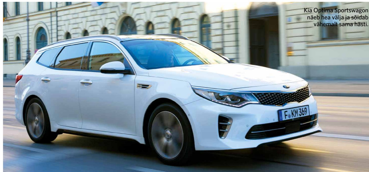
Kia Optima Sportswagon näeb hea välja ja sõidab vähemalt sama hästi.