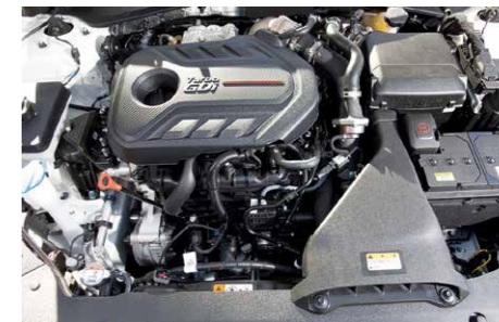
245hobujõuline turbomootor ei tee Optimast mürgeldajat, küll aga jõulise ja kiire sõiduki.